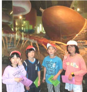
↓班別行動で見学しました